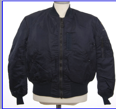
Bomber MA-1 Wool